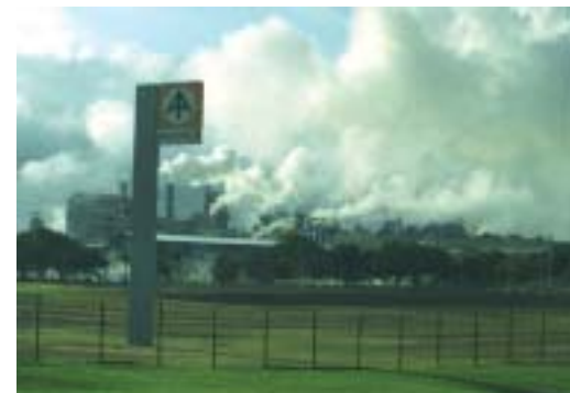
Aracruz-Zellstoffwerk in Espírito Santo

Für Tempo-Taschentücher, Charmin- und Hakle-Kloppapier werden in Brasilien Menschen vertrieben und die Umwelt wird zerstört: Für die Herstellung dieser Marken kaufen die Produzenten Procter&Gamble und Kimberly-Clark Eukalyptuszellstoff von Aracruz-Celulose in Brasilien. Aracruz-Celulose nimmt den Menschen in Brasilien das Land und zerstört ihren Lebensraum.