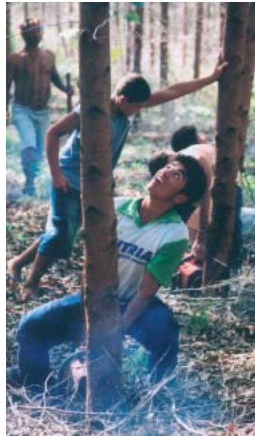
Indianer besetzen ihr Land