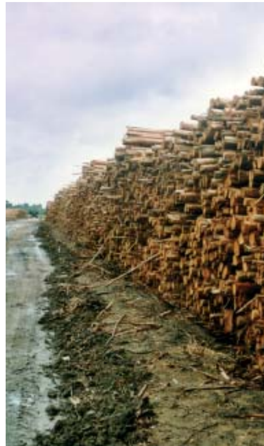
Eukalyptusholz für unser Kloppapier