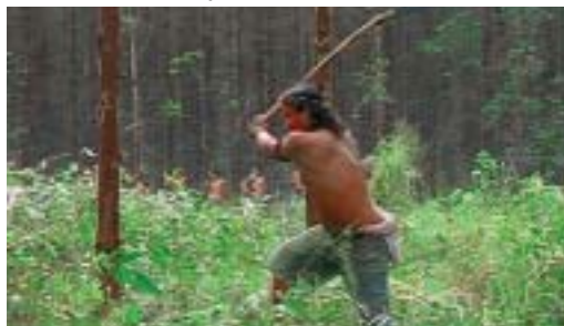
Indianer besetzen ihr Land

Als Aracruz 1967 mit der Zellstoff-Produktion in der brasilianischen Provinz Espírito Santo begann, nahm der Konzern große Landflächen für seine Eukalyptus-Monokulturen, aus denen der Zellstoff gewonnen wird, in Besitz. Dort lebten zu dieser Zeit verschiedene Bevölkerungsgruppen: die indigenen Völker Tupinikim und Guarani, Quilombolas (Nachfahren der Sklaven) sowie Kleinbauern. Sie alle nutzten das Land, hatten dafür jedoch keine Besitzdokumente. Deshalb konnte Aracruz sie leicht von dem Land vertreiben. Auch heute noch nimmt Aracruz immer neue Flächen in Anspruch.